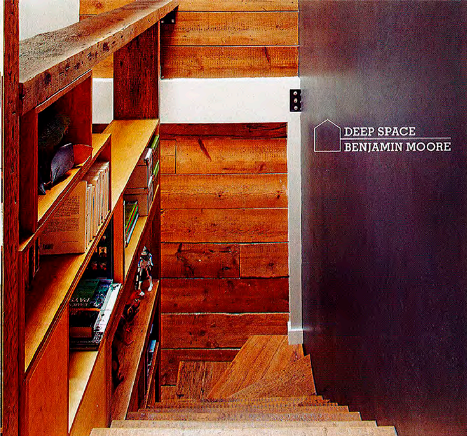
DEEP SPACE BENJAMIN MOORE